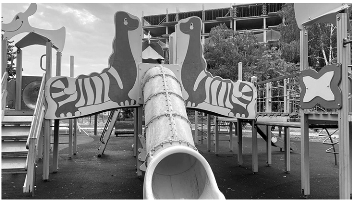
Детский комплекс в Черкесске после устранения поломки

В ходе надзорного мероприятия изложенные в обращении доводы подтвердились. По результатам проверки подрядчику, отвечающему за обслуживание игрового оборудования в парковых зонах города Черкесска, внесено представление.