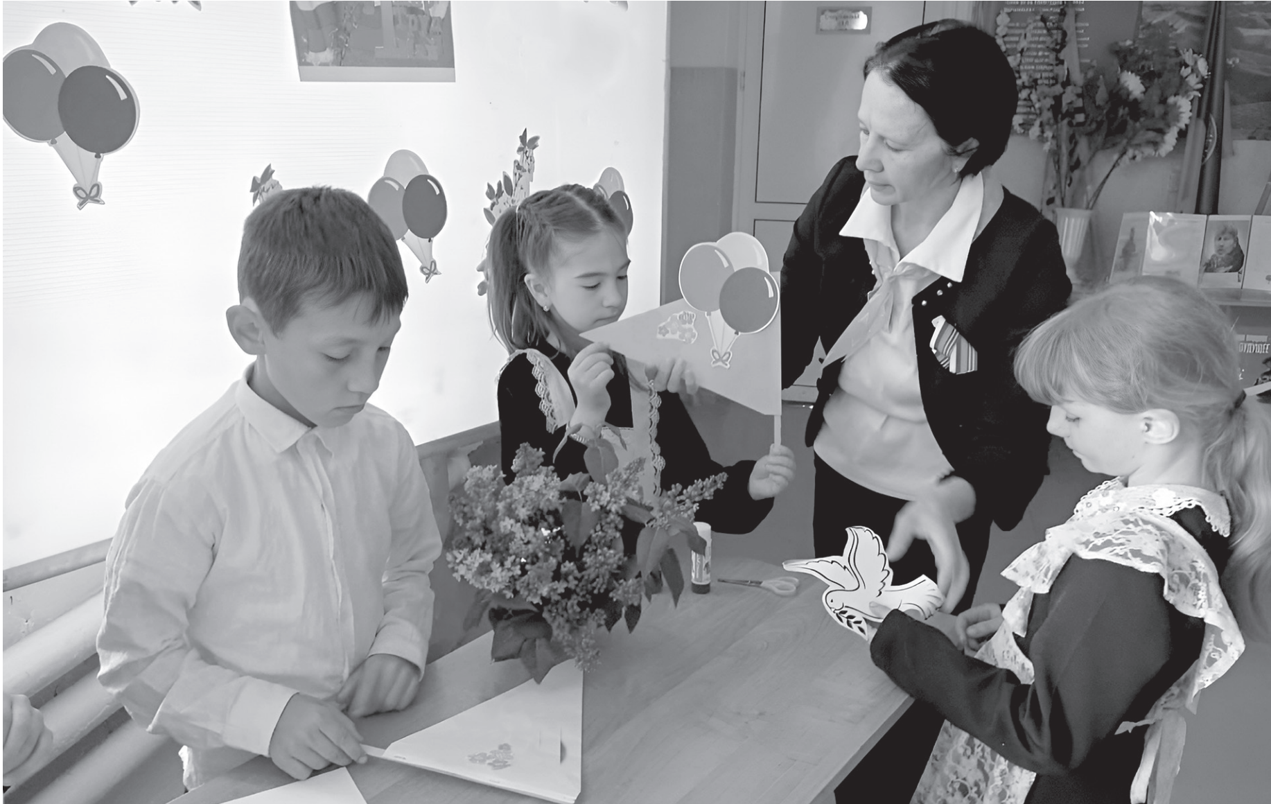
Никакие цифровые инструменты не заменят педагога, который не только учит, но и воспитывает учеников

«С 1 сентября вступает в силу приказ № 704 — основополагающий документ, завершающий формирование единого образовательного пространства в стране», — сообщил Сергей Кравцов. Министр подчеркнул особое внимание в приказе к детальному планированию уроков и унифицированным образовательным программам, созданным на основе опыта советской школы и передовых образовательных учреждений страны, устанавливающим высокие стандарты подготовки учащихся. Он отметил важность всестороннего развития знаний учащихся по всем предметам, а не только по тем, которые проверяются на едином государственном экзамене.